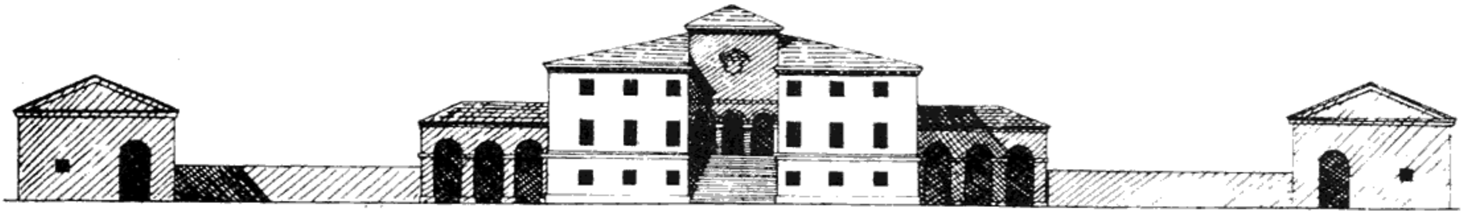
Modifica della facciata secondo un successivo progetto di Palladio.