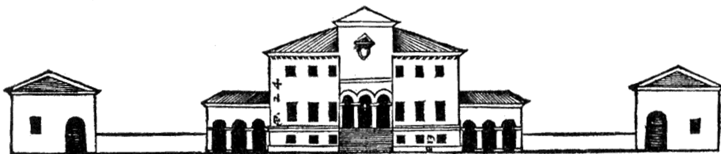
Fig. 3 Dai Quattro li- bri dell'Archi- tettura - N. Pal- ladio